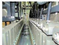
Auf die richtigen Mischung kommt es an: Marangoni hat jetzt in ein „Supersincro“-Dosiersystem für seinen Mischsaal in Rovereto investiert

Marangoni investiert weiter in seine Produktionstechnologie am Standort im norditalienischen Rovereto (Trient). Wie es dazu in einer Mitteilung des auf die Runderneuerung und den Maschinen-/Anlagenbau spezialisierten Unternehmens heißt, habe man zuletzt 2015 einen neuen Intermix-Mischer „mit ineinandergreifenden, in ihrem Abstand einstellbaren Rotoren“ in Betrieb genommen. Nun folge der nächste Entwicklungsschritt: die Installation eines automatischen Dosiersystems von Lawer, ebenfalls aus Italien. Mit dem „Supersincro“ genannten Dosierer für die Zuführung von Mischungskomponenten werde man den nächsten „Generationsprung im Mischsaal in Rovereto“ vollziehen und die Qualität der Mischungen weiter steigern, heißt es dazu in einer Mitteilung von Marangoni. „Mit dieser Investition werden die Qualitätsstandards und die Genauigkeit unseres auf nationaler und internationaler Ebene hochmodernen Mischsystems weiter gesteigert“, so Marangoni weiter. Die Entwicklungen des Runderneuerungsmarktes und „die ständigen Bemühungen um mehr Vorteile für ihre Kunden“ hätten die Marangoni-Gruppe dazu bewogen, „mit großer Beständigkeit in technische Innovationen zu investieren, um so der Nachfrage nach immer leistungsstärkeren Mischungen nachzukommen“. ab